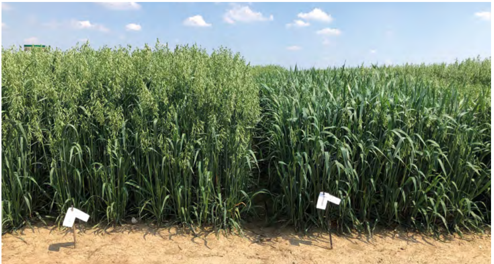
Links FLEURON – rechts RHAPSODY, Stand 11.06.2021

Der Erntezeitpunkt des Winterhafers liegt etwa 7 bis 14 Tage nach der Wintergerste. Die realisierbaren Mehrerträge bringt der Winterhafer durch seine höhere Bestandesdichte, seine bessere Ausnutzung der Winterfeuchte und die längere Vegetation.